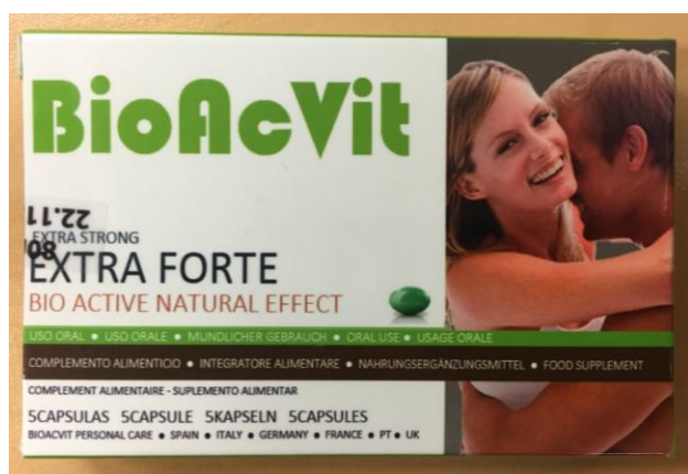
Fig.3: Imagen del producto BIOACVIT EXTRA FORTE CÁPSULAS.