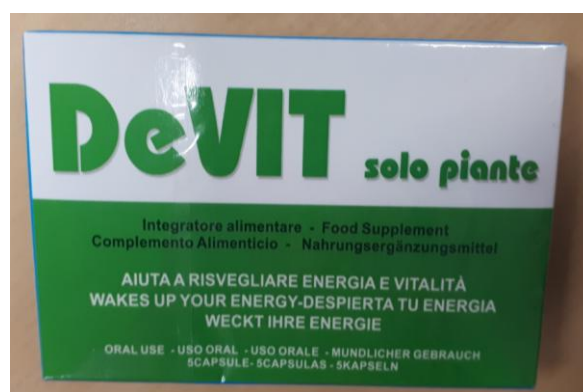
Fig.6: Imagen del producto DEVIT FORTE SOLO PIANTE CÁPSULAS.