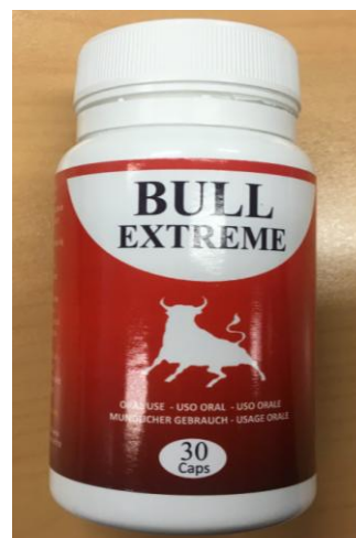
Fig.7: Imágenes del producto BULL EXTREME CÁPSULAS .