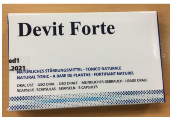
Fig.5: Imagen del producto DEVIT FORTE CÁPSULAS.