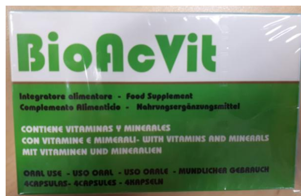
Fig.1: Imágenes del producto BIOACVIT CÁPSULAS.