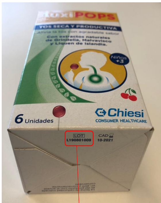
Identificación del lote en la caja de 6 unidades

Lote L190801009 de AUXIPOPS, pastillas para chupar, fabricado por APHARM S.r.l., Italia.